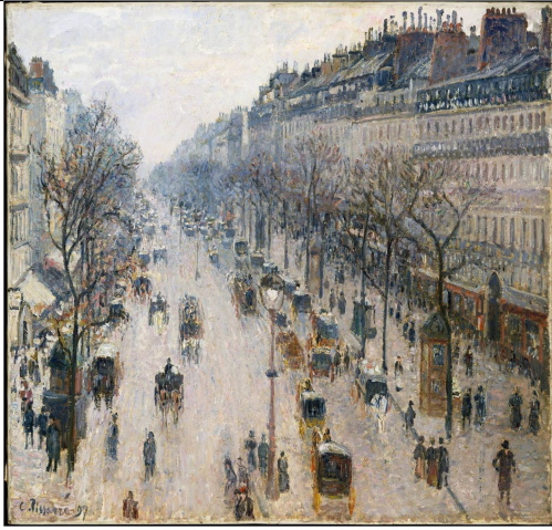
El boulevard Montmartre, mañana de invierno (1897), de Camille Pissarro